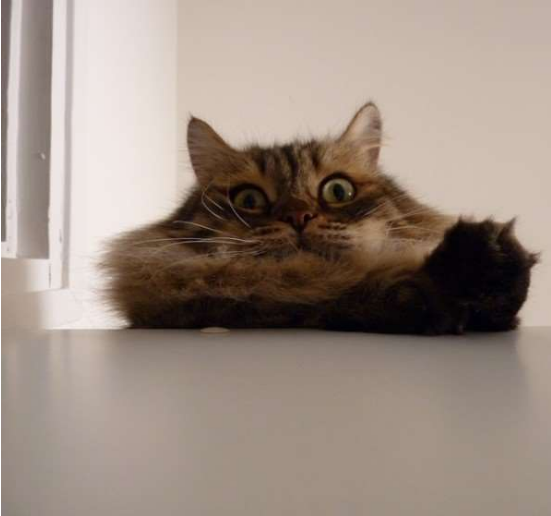
Кот Хэлпа.

Далее - традиционная рубрика "Семь ляпниц на неделе".