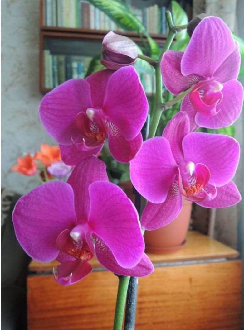
Мои орхидеи.

Далее - традиционная рубрика "Семь ляпниц на неделе".