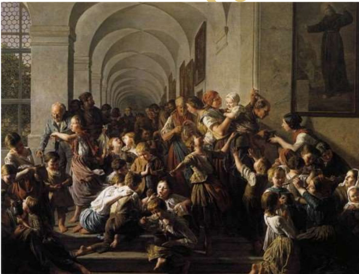
(Фердинанд Георг Вальдмюллер, Раздача чечевичного супа)

Сегодня мы приготовим такой же вкусный суп! Все будут сбегаться на запах и просить добавки!